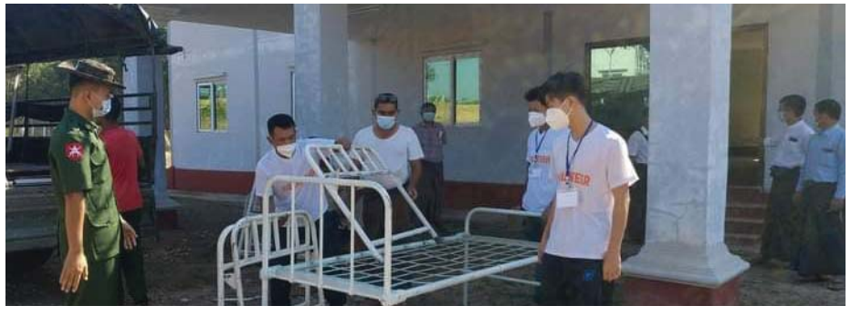
► စာမျက်နှာ(၂) “ကလေးစစ်သားအသုံးပြုမှု”မှအဆက်

ကရင်ပြည်နယ် တစ်ပြည် နယ်လုံး အတိုင်းအတာအနေဖြင့် ပြည်နယ် ကျန်းမာရေးဦးစီးဌာန ၏ နိုဝင်ဘာ ၁၇ ရက်နေ့ည ထုတ်ပြန်ထားသည့် စာရင်းအရ လက်ရှိ ပြည်နယ်ထဲတွင် ဆေးရုံ တက်နေရဆဲ ကိုဗစ်ပိုးတွေ့လူနာ စုစုပေါင်း ၁၄၇ ဦးရှိအနက် ဖား အံနှင့် ကော့ကရိတ်မြို့နယ်တွင် ကိုဗစ်ပိုးလူနာ အများဆုံးတွေ့ရှိ ရသည်ဟု သိရသည်။