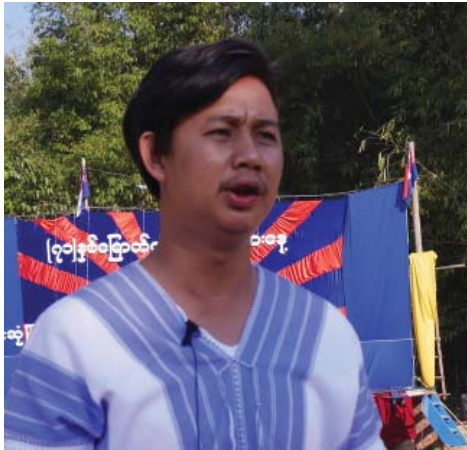
စောသောကြာ