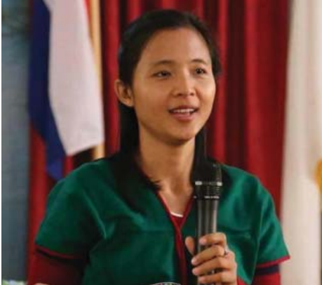
နော်ဆဲဆဲ

နိုဝင်ဘာ ၂၅ ရက်နေ့တွင် ကျရောက်သည့် 'အပြည်ပြည်ဆိုင်ရာ အမျိုးသမီးများအပေါ် အကြမ်းဖက်မှု ပပျောက်ရေးနေ့' နှင့်ပတ်သက်၍ အရပ်ဖက်နှင့် နိုင်ငံရေးပါတီများမှ ကရင်ခေါင်းဆောင်အချို့၏ ပြောစကားများကို ထည့်စုစည်းဖော်ပြလိုက်ပါသည်။