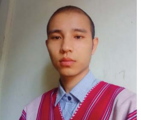
စောအယ်ကော်