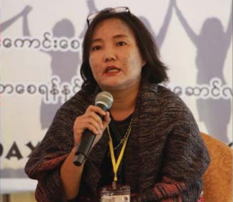
နော်ယုဇနဝါ