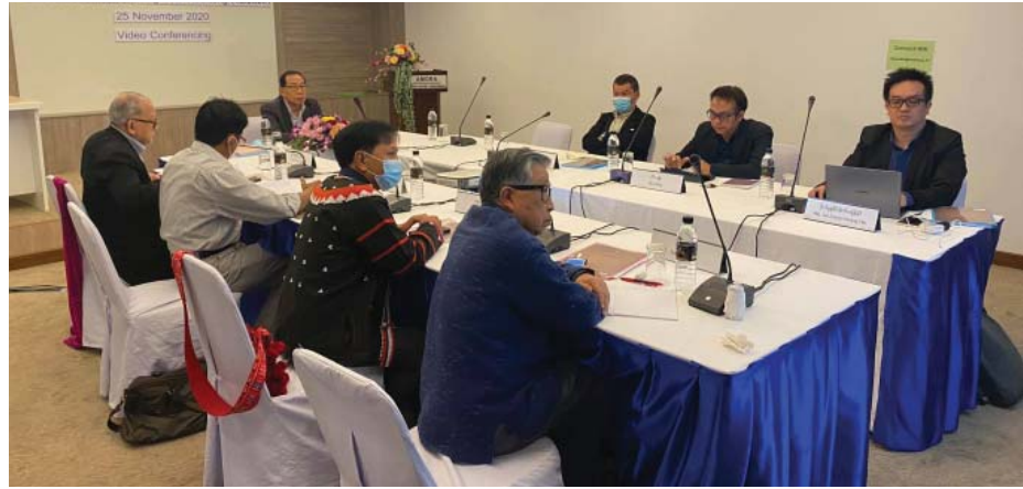
► ကျောင်း “အမျိုးသမီးအပေါ်အကြမ်းဖက်မှု” မှ အဆက်

NCA အပစ်ရပ် တိုင်းရင်းသား အဖွဲ့အစည်းများတွင် ကရင်အမျိုးသား အစည်းအရုံး -KNU၊ ချင်းအမျိုးသားတပ်ဦး -CNFI၊ မြန်မာနိုင်ငံလုံးဆိုင်ရာ ကျောင်းသားများ ဒီမိုကရက်တစ်တပ်ဦး -ABSDF၊ ကရင်ငြိမ်းချမ်းရေးကောင်စီ -KNU/KNLA(PC)၊ ဒီမိုကရေစီအကျိုးပြု ကရင်တပ်မတော် -DKBA၊ ပအိုဝ်းအမျိုးသား လွတ်မြောက်ရေးအဖွဲ့ချုပ် -PNLO၊ ရခိုင်ပြည် လွတ်မြောက်ရေးပါတီ -ALP၊ ရှမ်းပြည် ပြန်လည်ထူထောင်ရေး ကောင်စီ -RCSS၊ မွန်ပြည်သစ်ပါတီ -NMSP နှင့် လားဟူဒီမိုကရက်တစ် အစည်းအရုံး -LDU တို့ ဖြစ်သည်။