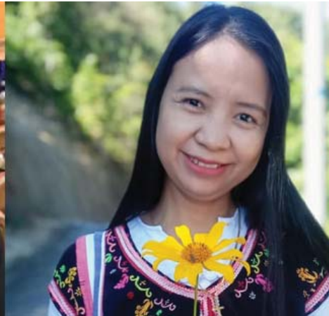
နော်မာမာချို