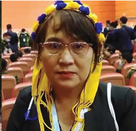
နော်တကော်ထူး