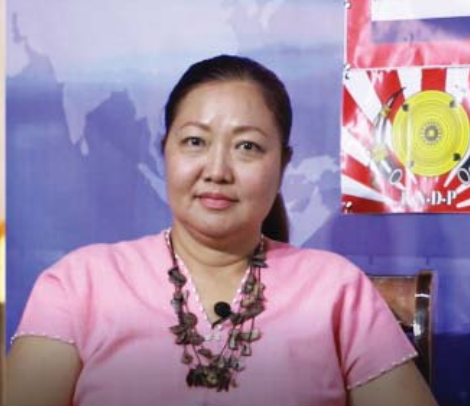
နော်သခင်တုပ်