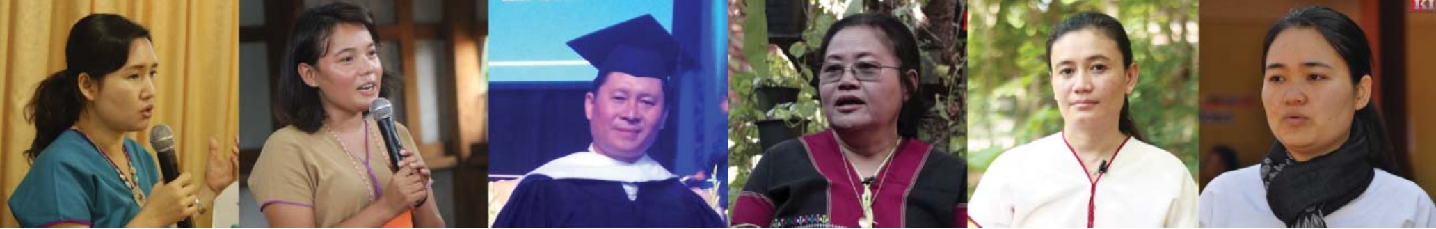
နော်ထူးထူး

ယနေ့ နိုဝင်ဘာ ၂၅ ရက်နေ့တွင် ကျရောက်သည့် 'အပြည်ပြည်ဆိုင်ရာ အမျိုးသမီးများအပေါ် အကြမ်းဖက်မှု ပပျောက်ရေးနေ့' နှင့်ပတ်သက်၍ နယ်စပ်ဒေသရှိ အလွှာအသီးသီးမှ ကရင်ခေါင်းဆောင်အချို့၏ ပြောစကားများကို စုစည်းဖော်ပြလိုက်ပါသည်။