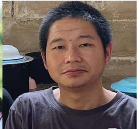
စောကျော်လင်း

ပါတီစုံဒီမိုကရေစီ အထွေထွေ ရွေးကောက်ပွဲကို ၂၀၂၀ နိုဝင်ဘာလ ၈ရက်နေ့တွင် တစ်နိုင်ငံလုံး အတိုင်းအတာဖြင့် ပြည် နယ်နှင့် တိုင်းဒေသကြီးများအထိ အသီးသီး ကျင်းပခဲ့ကြသည်။ အဆိုပါရွေးကောက်ပွဲ၏ လတ်တလော ရလဒ်နှင့် အခြေအနေများအပေါ် ကရင်အရပ်ဖက်အဖွဲ့များ၏ အမြင်သဘောထားများကို မေးမြန်းတင်ဆက်လိုက်ပါသည်။